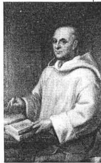
Portret van Guigo, La Grande Chartreuse.

Guigo maakte tijdens zijn prioraat de verschrikkelijke lawine in het Chartreusemassief mee, die het oorspronkelijke kloostertje van Bruno bijna geheel verwoestte en verschillende monniken het leven kostte. De prior nam de beslissing om lager in het dal een nieuw klooster te bouwen, in de vallei waar zich tot op heden de imposante kloosterburcht van La Grande Chartreuse bevindt. Voorts maakte de markante persoonlijkheid van Guigo dat hij binnen de kortste keren ook tot ver buiten de Alpen bekend werd. Zo ontstonden hechte vriendschappen met grote geestelijke leiders, o.m. met Bernardus van Clairvaux en met Petrus Venerabilis, de abt van Cluny. Guigo overleed op 27 juli 1136, ernstig ziek en geheel uitput na vele jaren van plichtsbewuste dienst.