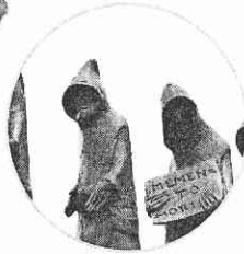
De heilige Bruno en zijn volgelingen, brons (maker onbekend). De derde monnik in de rij draagt een bordje met het opschrift 'Memento mori' (gedenk dat je zult sterven).

De eenzame gestalte van de profeet Jeremia die zowel aanklacht als hoop betekende voor zijn volk, was voor de prior de favoriete bijbelse icoon van het stilleven van de kartuizers.