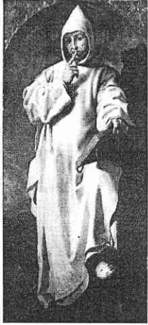
Francisco Ribalta, De heilige Bruno, olie op doek, Barcelona.

De twee pioniers van de kartuizerorde zijn ontegensprekelijk Bruno van Keulen en Guigo I: de eerste wordt de grondlegger genoemd en de tweede de wetgever.