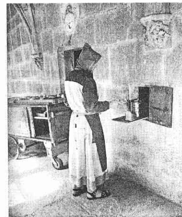
Voedselbedeling via doorgeefluik.

De profeet Jeremia schrijft: ‘De eenzame zit neer en zwijgt, en hij zal zich boven zichzelf verheffen.’ Hiermee drukt hij uit wat zo edel is in onze levenswijze: rust en eenzaamheid, stilte en smakend verlangen naar het hogere. (80,7)