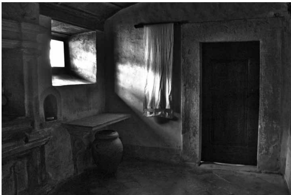
Kluis in de Sacro Eremo van Camaldoli.

camaldulenzenorde door Rome canoniek erkend. De prior van de Sacro Eremo werd benoemd als hoofd van drie hermitages en 25 kloosters. Meteen verraadt dit onevenwicht het wormpje dat stilletjes de eremitische wortel van de camaldulenzenboom had aangevreten. Tegen het begin van de zestiende eeuw was het zo gulzig geweest, dat alleen nog in Camaldoli zelf kluizenaars te vinden waren. Een terugkeer naar de oorsprong werd een noodzaak. Met de intrede van een jonge monnik in 1510, de zalige Paulus Giustiniani (1476-1528), die ook prior werd, schoot een nieuwe twijg op die al vlug zou uitgroeien tot een nieuwe tak binnen de orde. De voortdurende onrust die de af- en aanloop van pelgrims en cenobitische monniken in de Sacro Eremo teweegbracht, deed Giustiniani besluiten om de solitaire rust elders te zoeken. Hij trok zich terug in een grot nabij Perugia. Toen enkele volgelingen zich bij hem aansloten, nam hij zijn Regel voor eremieten en reclusen , die hij destijds als prior geschreven had, als richtsnoer voor de nieuwe communauteit en voor alle latere stichtingen. Rond 1530 werd de hermitage op de Monte Corona 7 bij Perugia het moederklooster van de Congregatie van de Camaldulenz-eremieten van de Monte Corona . 8 Giustiniani brak dus voorgoed met de cenobitisme in de romualdese traditie. Vandaag heeft de congregatie kloosters in Italië, Polen, Spanje, de Verenigde Staten en Venezuela.