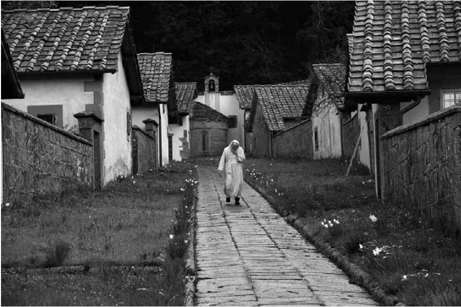
Steegje in de Eremo di Camaldoli.

hermitage uit verschillende rijen van drie tot zes (of zelfs nog meer) cellen naast elkaar. 3 Vanuit de lucht lijkt het wat op een minidorpje, met rijen huisjes links en rechts.