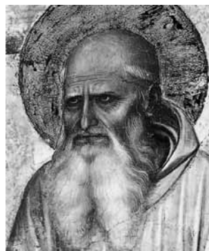
Sint-Romualdus. Detail uit het fresco Kruisiging met heiligen van Fra Angelico (1395-1455), klooster van San Marco, Firenze.

Wat meteen opvalt, is het geduld waarmee de monniken, en zeker de nieuwelingen, worden benaderd: ze mogen zich niet te vlug laten ontmoedigen door gedachten of verstrooiingen die het gebed doorkruisen. Volhouden is de boodschap van de meester! Heel bijzonder in de Kleine Regel is de verwijzing naar de keizer: Romualdus was min of meer gewoon om met de groten der aarde om te gaan. Hij ontmoette meermaals Otto III en Hendrik II (ca. 978-1024). Een monnik moet voor God staan zoals een onderdaan voor de keizer: weliswaar nederig en eerbiedig, maar tegelijk ook vrij en mondig. Het kleine diertje ( 'pullus' , afgeleid van 'parvulus' , 'klein') verwijst uiteraard naar de relatie tussen God als Schepper en de mens als schepsel. De metafoor van de kloek en het kuiken is niet ver weg. Tot slot willen we nog even aanstippen dat Romualdus God niet wil vervrouwelijken door het beeld van de moeder te gebruiken: God is geen moeder, maar handelt als een moeder. Het toekennen van vrouwelijke of moederlijke kwaliteiten aan God is trouwens niet zo vreemd aan de middeleeuwse mystiek.