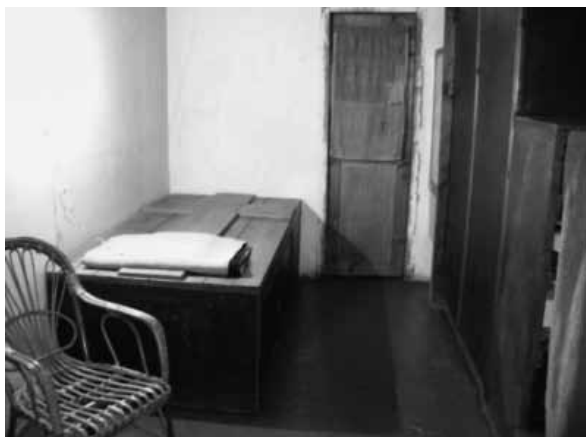
De kluis van zuster Nazarena Crotta in het camaldulenzersinnenklooster van Sant'Antonio Abate in Rome. Ze sliep er op een houten verhoog waarop een kruis was bevestigd. Naast haar slaapstee een smal deurtje met een lap stof die nooit opzij ging, ook niet als haar bezoeker erom vroeg.

fysieke gezondheid en het psychologisch evenwicht. Het is alleen aan de prior toegestaan om de reclusen eens per week te bezoeken. Hij kan trouwens ook beslissen om de observantie tijdelijk op te schorten. Bij de camaldulenzers-eremieten van Monte Rua bij Padua leefde dom Gianmaria uit Tokyo maar liefst zestien jaar ononderbroken als recluse tot zijn dood in 2009. Momenteel is er nog één levenslange recluse, dom Nicolas uit Portorico, die bij de camaldulenzers-eremieten in Ohio (USA) verblijft.